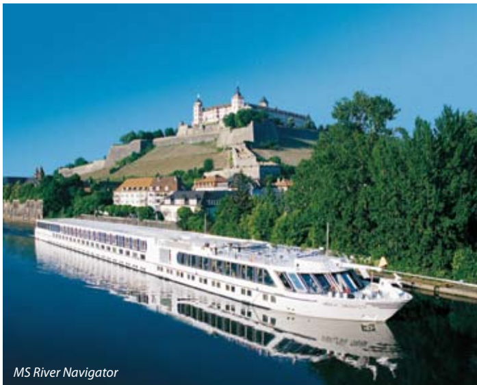
MS River Navigator