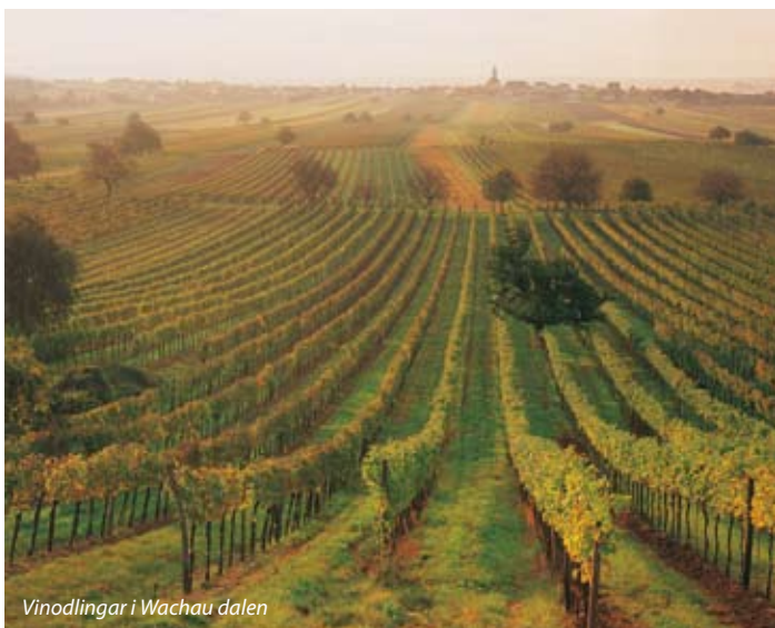
Vinodlingar i Wachau dalen